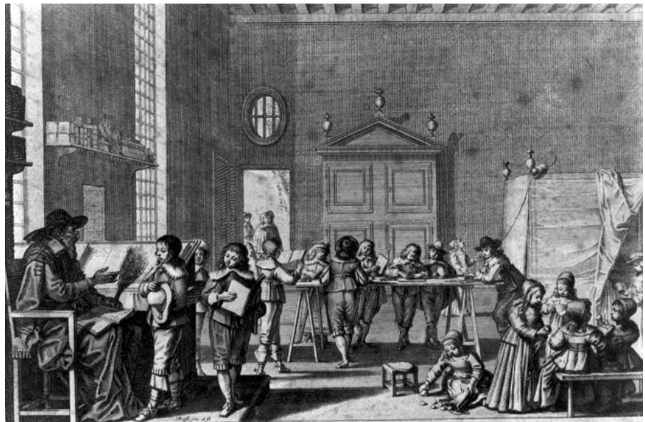
LE MAÎTRE D'ÉCOLE. Cet habile Maître d'école, Accoutumé par son bruit, Qui font les enfants qu'il instruit, Joint les verges à la parole. Les vus d'une étrange façon, Apprennent la discipline, Et semble pleurer à leur mine, Quand ils apprennent leur leçon. Mais les autres tout au contraire, Par un folâtre jeuiment, EN ont l'esprit qu'au jeu seulement, Dont ils ne peuvent se distraire. Foy quitte moqueries de leurs jeux, Sache qu'ils sont pleins d'innocence, Et jouent-les qu'en ton langage, Tu cherches à faire comme eux.

De ef , Le Cha b - -Lg , Me : e e b a e a ad e a ee e de a cef ege de e d ca f g a . a de de de ce e a , de a de e e cfc de a dag g e e a e e e e e ac a a dh .