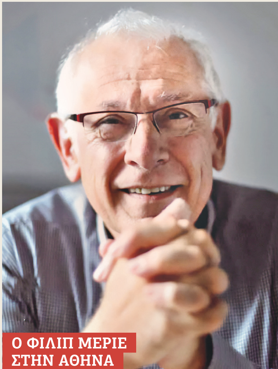
Ο ΦΙΛΙΠ ΜΕΡΙΕ ΣΤΗΝ ΑΘΗΝΑ