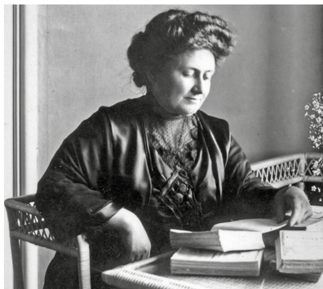
La doctoresse Maria Montessori (ici en 1913) a conçu des outils très précis, censés correspondre aux «lois du développement de l'enfant»

Ce n'est qu'avec la Première Guerre mondiale que ces idées vont «crystalliser». (...) Et, pour éviter le retour de la haine et du carnage, ils ( les éducateurs ) misent sur une autre éducation, authentiquement humaniste (...) plaçant l'éveil ainsi que la formation à la solidarité au cœur de tout enseignement. En 1921 se tient le Congrès de Calais, congrès fondateur de la Ligue internationale de