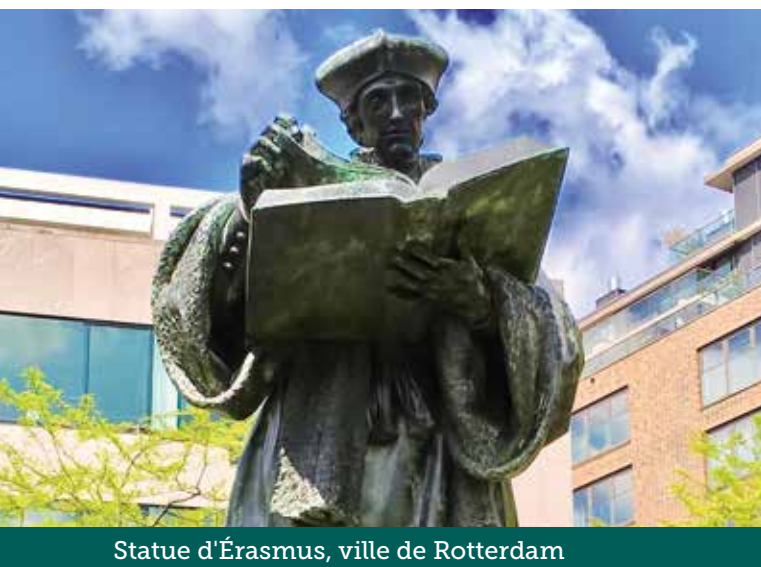
Statue d'Érasme, ville de Rotterdam

Rousseau dans son essai Émile, ou De l'éducation (1762) réfléchit à une manière d'éduquer les enfants qui ne contredit pas leur nature profonde. Émile apprend par lui-même en explorant la nature; il développe ainsi ses facultés sensorielles et son esprit de déduction. L'expérience, les activités manuelles et physiques priment sur les livres. Rousseau insiste sur la nécessité de s'adresser à l'enfant en tant qu'être doté d'une identité distincte de celle de l'adulte. Les éducateurs «s'attachent à ce qu'il importe aux hommes de savoir, sans considérer ce que les enfants sont en état d'apprendre. Ils cherchent toujours l'homme dans l'enfant, sans penser à ce qu'il est avant que d'être homme. (...) Commencez donc par mieux étudier vos élèves; car très assurément vous ne les connaissez point.»